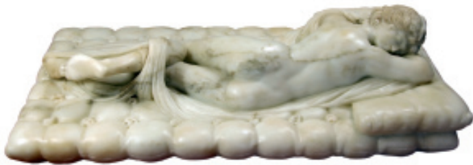
Hermafrodita Borghese. Còpia del segle XVIII d'un taller romà.