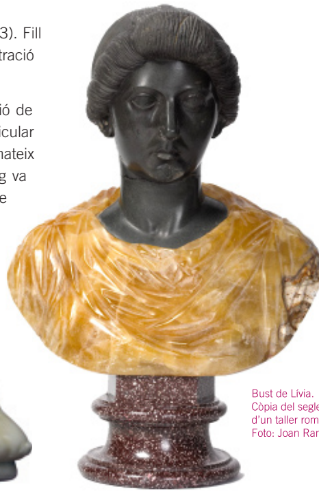
Bust de Livia. Còpia del segle XVIII d'un taller romà.

El Museu d'Història de la Ciutat allotja una part important d'aquesta col·lecció, adquirida per l'Ajuntament de Palma el 1923 gràcies a la intervenció de la Societat Arqueològica Lul·liana i d'un grup d'intel·lectuals mallorquins.