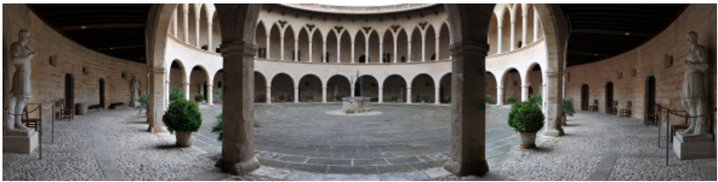
Pati d'armes.