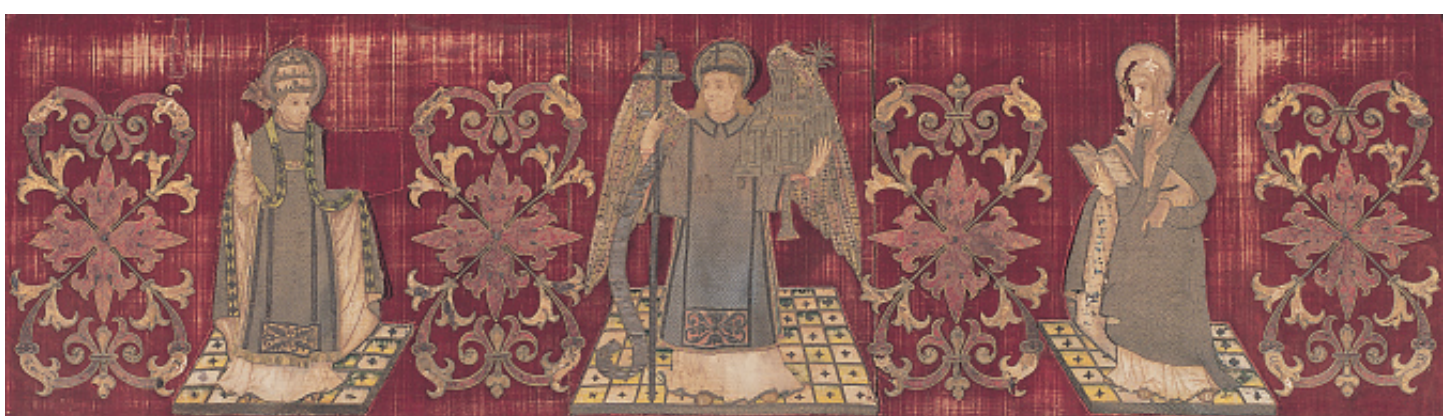
Frontal d'altar de la capella de Sant Marc, c.1550.